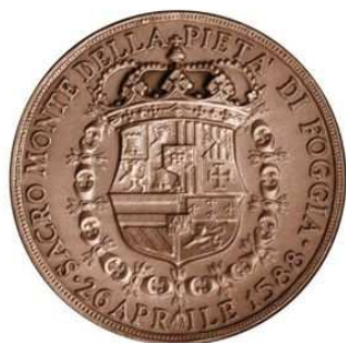
FONDAZIONE BANCA DEL MONTE "Domenico Siniscalco Ceci" Foggia

GRAZIE alla partnership fra l'Associazione Culturale Carpino Folk Festival e il Gruppo di Azione Locale del Gargano (Gal Gargano) nell'ambito della XIX edizione del festival della musica popolare e delle sue contaminazioni verrà realizzato il progetto Piazza Gal, un luogo dove il pubblico potrà vivere la nostra cultura rurale e le nostre tradizioni gastronomiche, artigianali e culturali, dove cioè si potranno degustare le nostre specialità gastronomiche, si potranno imparare a preparare i piatti della tradizione rurale, conoscere le nostre erbe selvatiche spontanee, scoprire e degustare i nostri vini e il nostro olio, ma anche ballare le nostre tarantelle garganiche e i concerti del Carpino Folk Festival. L'obiettivo della collaborazione è di potenziare l'attrattività economica e turistica del territorio Garganico, in un'ottica di marketing territoriale, e di diffondere e valorizzare i prodotti della tradizione rurale, il patrimonio naturale e la cultura del territorio attraverso le suggestioni delle rappresentazioni artistiche locali.